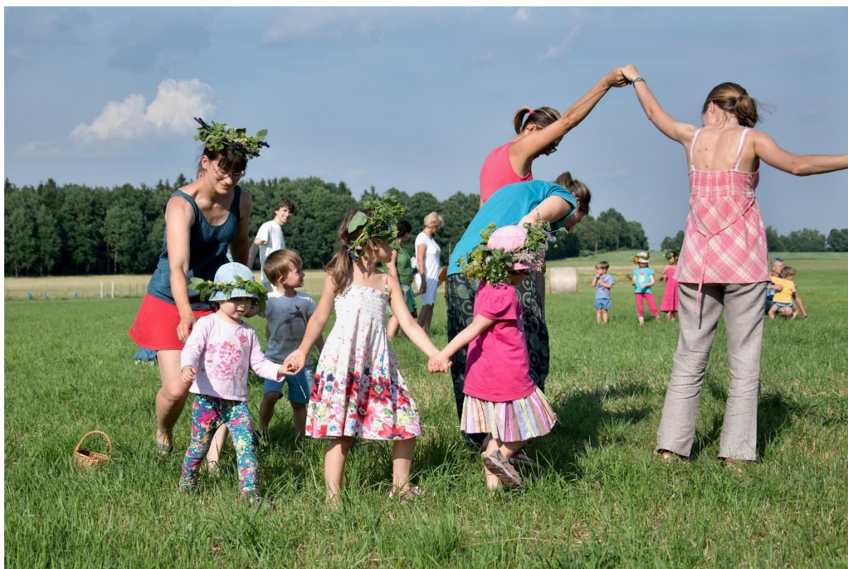
S kmotříčky z 5. třídy